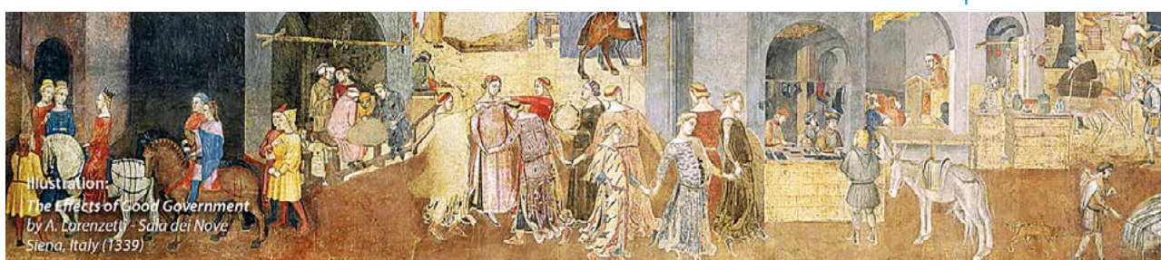
Illustration: The Effects of Good Government by A. Lorenzetti - Sala dei Nove Siena, Italy (1339)

cia przez Gminę Europejskiego Znak Jakości Zarządzania w Samorządzie Terytorialnym. Jednym z warunków przyznania tego znaku jest wypełnienie ankiety przez min. 350 mieszkańców. Ostateczny termin wypełniania ankiet to 17.07.2023 roku. Serdecznie zachęcamy do udziału w wypełnieniu krótkiej ankiety, która jest zamieszczona na oficjalnej stronie gminy Strawczyn pod linkiem: https://strawczyn-obyw-2023.webankieta.pl/