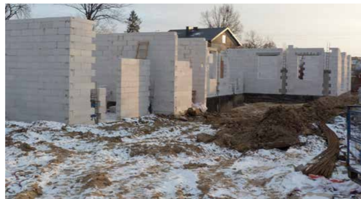
Budowa kompleksu przedszkolno-żłobkowego w Promniku