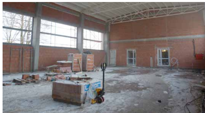
Rozbudowa szkoły w Rudzie Strawczyńskiej

Koszt inwestycji to prawie cztery miliony złotych, a część tej kwoty pokryje dofinansowanie zewnętrzne pochodzące z funduszy unijnych, które samorząd gminy Strawczyn pozyskał z RPO Województwa Świętokrzyskiego na lata 2014-2020 z działania 7.4, a także z Ministerstwa Kultury i Sportu z Programu Sportowa Polska. Planowane zakończenie robót budowlanych przewidziano na 31 maja tego roku.