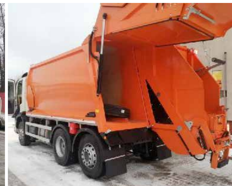
HARMONOGRAM WYWOZU ODPADÓW KOMUNALNYCH Z TERENU GMINY STRAWCZYN W 2022r W MIEJSCOWOŚCI: