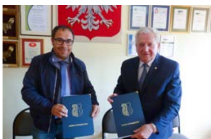
Umowa na budowę żłobka w Oblęgorku podpisana