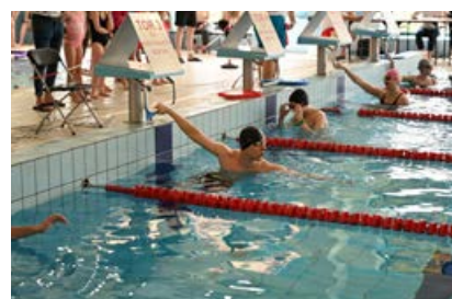
Wiosenne zawody pływackie w pływalni Olimpik w Strawczynku – były duże emocje i dobra zabawa