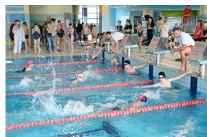
Ponad 230 uczestników wystartowało w IX Mikołajkowych Zawodach Pływackich