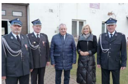
Remiza w Oblęgorku przejdzie termomodernizację