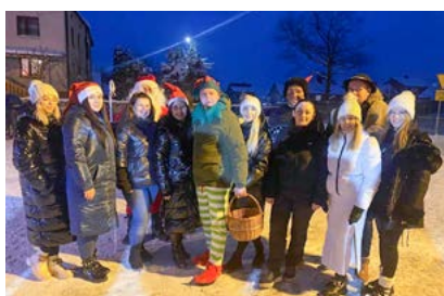
Jarmark Bożonarodzeniowy organizowany przez Promniczanki staje się piękną tradycją w gminie Strawczyn